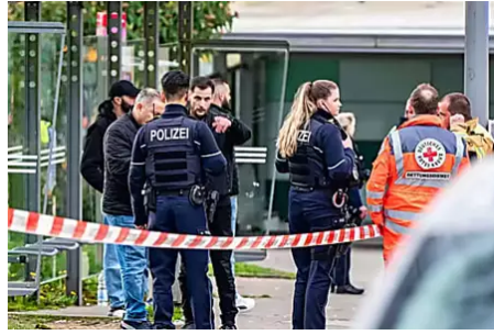
Mann stirbt nach Schüssen - Tatverdächtige noch Teenager - Panorama