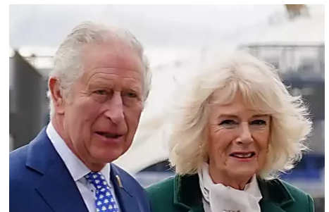
Krönung mit heikler Sitzordnung - Ausland