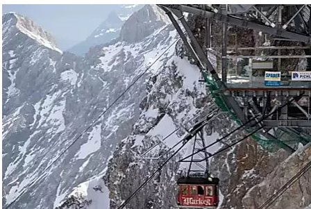
Schlafender Mann auf Zugspitze - Rettungskräfte beobachten Livestream - Garmisch-Partenkirchen