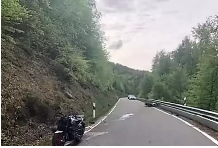
Motorradunfall: Saarländer stirbt - Eppenbrunn/Ludwigswinkel