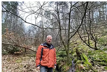
Wasserversorgung in Gefahr? Pfälzer Forscher sprechen von ersten Warnsignalen - Pfalz - DIE...